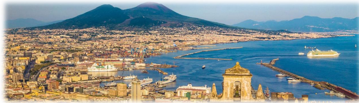
Napoli / Naples