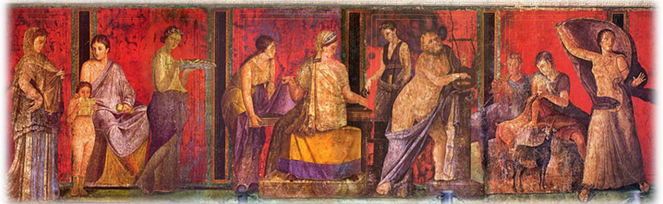
Fresque de la villa des mystères à Pompéi