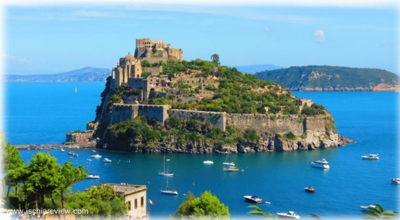
Visite de l'île d'Ischia