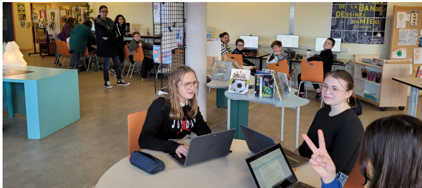
Le comité de rédaction du P'tit Fernel.

Le Collège Jean Fernel a un nouveau média : Le P'tit Fernel. Découvrez avec nous les coulisses de ce nouveau journal.