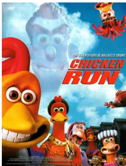
L'affiche du film Chicken Run.

Synopsis : bref exposé écrit d'un sujet de film.