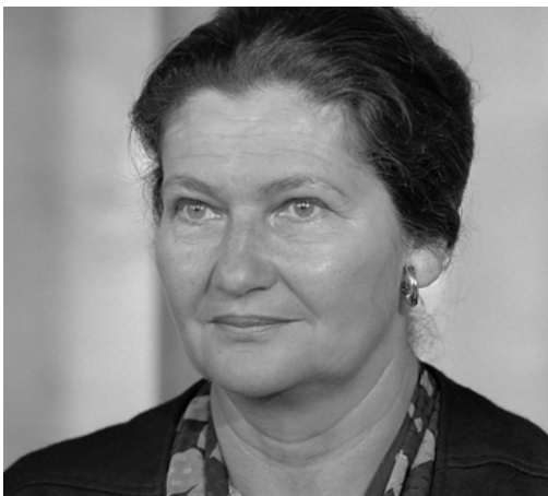
Simone Veil en 1984 au Parlement Européen.

Nous connaissons tous Simone Veil pour son combat sur l'IVG (Interruption Volontaire de la Grossesse = avortement), mais revenons sur le parcours de cette loi et l'engagement de cette femme icône de la lutte pour les droits humains.