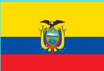
Drapeau de l'Equateur.