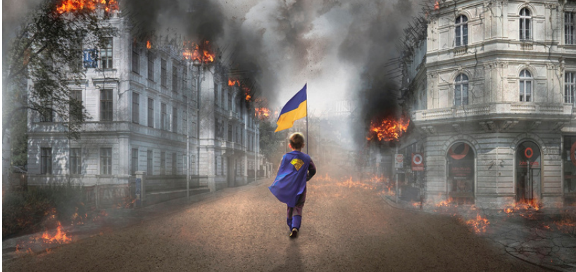
Montage d'un enfant tenant un drapeau ukrainien dans une rue en ruines.

La guerre en Ukraine fait depuis plusieurs mois la une des journaux. Retour sur les causes du conflit.